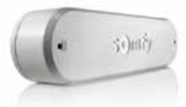
Automatisme vent Avec an mom tre ou capteur de mouvement.