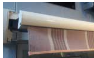
Lambrequin sur mesure possible de 12   20 cm (droit ou en onde)