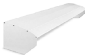
Auvent de protection de la toile